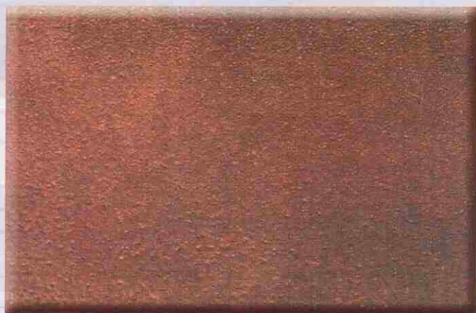
GRADO S.A. 1 Arenado-Granallado Ligero

Se especifican a continuación, diferentes grados de preparación, con ejemplos fotográficos representativos.