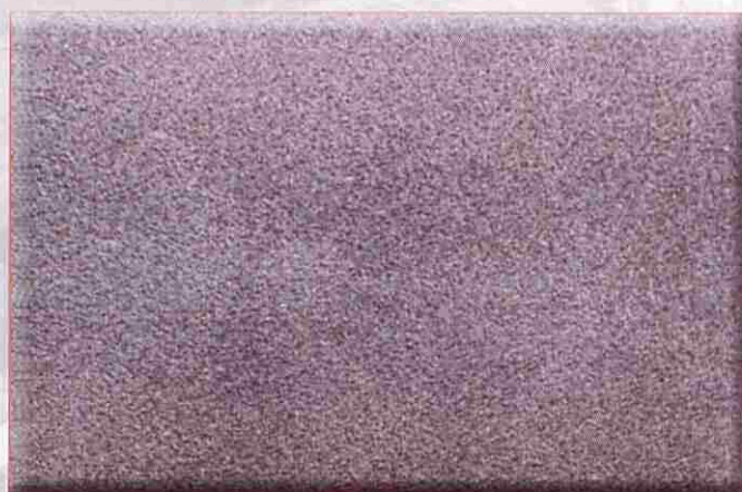
GRADO S.A. 2 Arenado-Granallado minucioso

Se quita la capa suelta de laminación, el óxido suelto y las partículas extrañas sueltas.