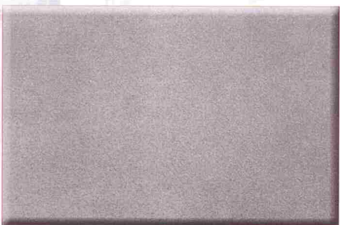
GRADO S.A. 3 Arenado-Granallado a metal blanco

Las capas de laminación, óxido y partículas extrañas se quitan de manera tan perfecta, que los restos solo aparezcan como ligeras manchas.